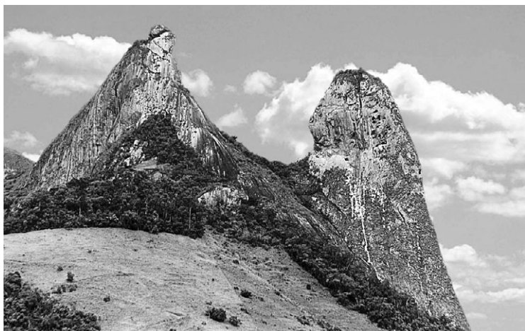
O Frade e a Freira, uma das maiores belezas naturais do país