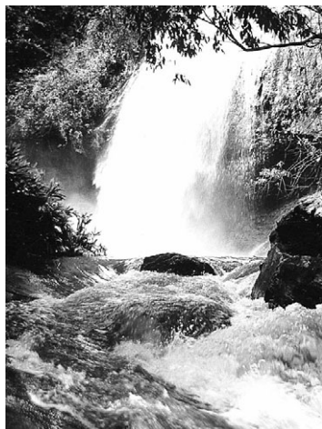
Cachoeira do Brother

A famosa cozinha italiana oferece do mais simples ao mais sofisticado menu. Os seus vinhos, licores e cachaças, são fabricados nas suas próprias fazendas, assim como embutidos, queijos, biscoitos e doces. A cidade situa-se em plena região montanhosa do Espírito Santo, com uma altitude de 590 metros e fica apenas a 137 quilômetros da capital, Vitória e a 30 minutos de Cachoeiro de Itapemirim. Em poucos quilômetros, pode se mudar do ar frio da montanha para desfrutar de cálidas e exuberantes praias.