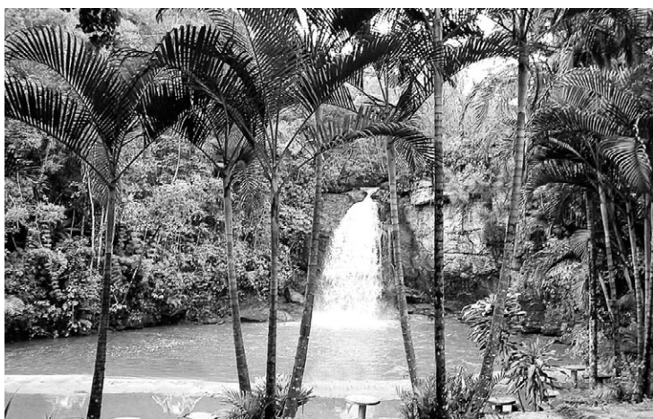
Cachoeira do Caiado