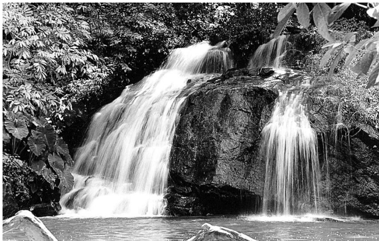
Cachoeira de Concórdia